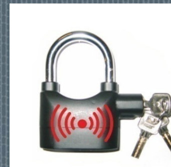
Riasztó lakat 3.700.- Ft