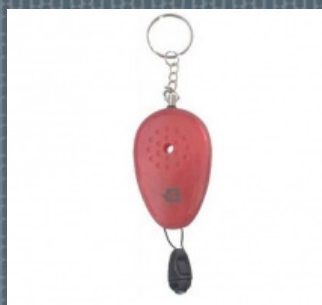
Személyi riasztó 300.- Ft