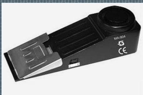
Elektronikus ajtóék 1.300.- Ft

A Borsod-Abaúj-Zemplén Megyei Bűnmegelőzési Alapítvány közreműködésével segítünk kedvező árú technikai védelmi eszközök beszerzésében: